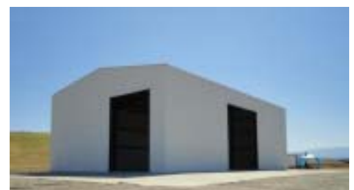
とうもろこしの栽培状況と建設中の野菜加工場